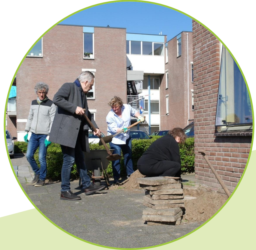
CAZAS Wonen Woerden