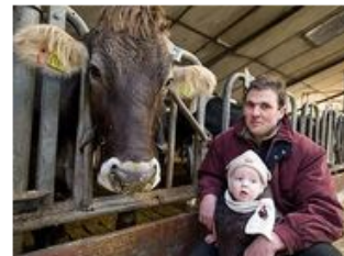
Biologische landbouw Melkveehouderij de Haan