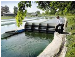
Biologische landbouw Ingrepro