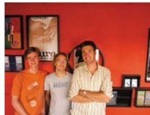
Kunst en cultuur De Ruimte Ontwerpers