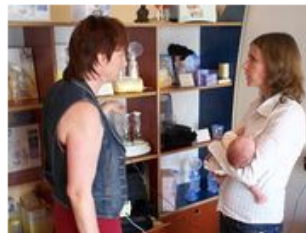
Zorg Borstvoedingspraktijk Osdorp