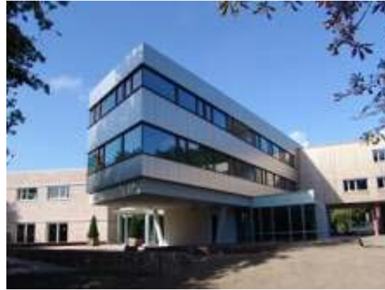
Head office, Zeist