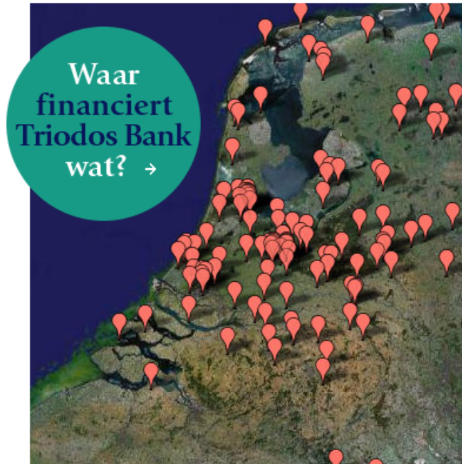
> Klik op de kaart om in te zoomen naar dat gebied.