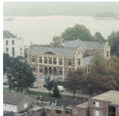
Voormalige Arrondissementsrechtbank te Tiel uit 1882. Het gebouw werd in 1996 gerestaureerd en intern uitgebreid (onderhuis en deel kapruimte werden functioneel gemaakt); het biedt huisvesting aan diverse rijks-gebruikers. Door de goede score op materiaalgebied kan het pand concurreren met de beste dubo-gebouwen, dit ondanks het feit dat de vensters hun historische, enkele beglazing hebben behouden