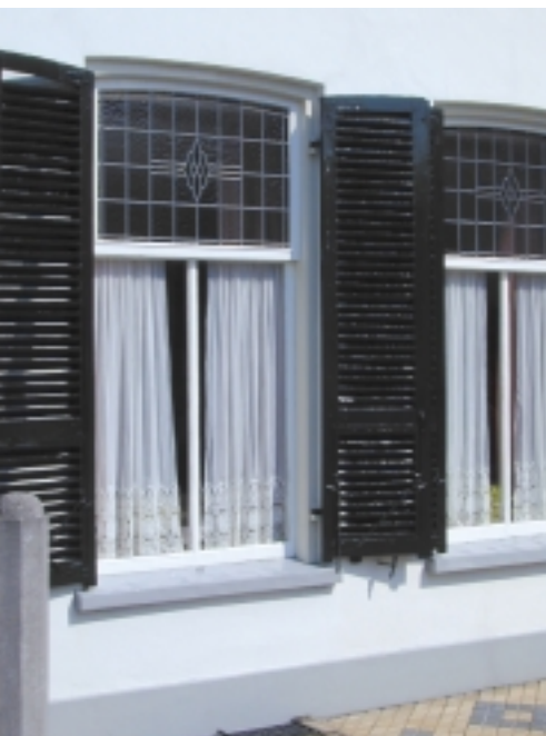
Luiken en zonblindes kunnen een belangrijke rol spelen in de klimaatbeheersing. 19de-eeuws voorbeeld van zonnerakken