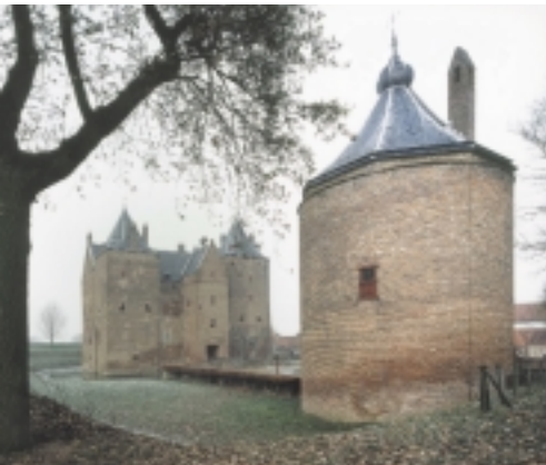
Slot Loevestein; overzicht van het middeleeuwse slot. Een warmtepompinstallatie vervangt het energievretende en voor het gebouw risicovolle systeem van stralingsverwarming met butagas. In deze situatie een prima methode om mens en monument een gezond en behaaglijk binnenklimaat te bezorgen