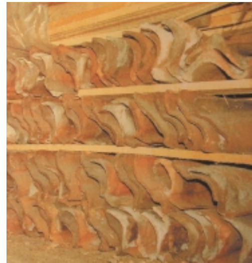
Opslag van historische dakpannen voor hergebruik op monumentale daken