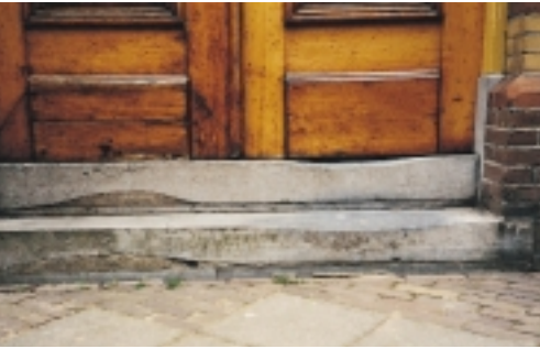
Hardstenen voordeurdorpel en traptrede. Na lang gebruik en toegang via de rechter deurleugel draaide men dorpel en trede om en verkreeg zo een opgang die 'als nieuw' was. Schoolvoorbeeld van argeloos hergebruik en duurzame monumentenzorg

Een van de belangrijkste kenmerken van monumenten is dat de gemeenschap ze zo waardevol vindt dat ze voor langere tijd behouden moeten blijven. Dit in tegenstelling tot gebouwen zonder die extra culturele betekenis, die een beperkte economische levensduur hebben (afgeschreven na circa 75 jaar) en die daarna worden afgebroken om plaats te maken voor nieuwbouw.