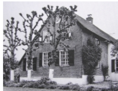
Leilinden bij een monumentale boerderij in de Alblasserwaard. Uitsstekende natuurlijke zonwering die 's winters 'automatisch' buiten bedrijf is

Dubbelglas in een dikte van 11 mm. Het dubbelglas komt in uiterlijk aspect redelijk overeen met historische enkele beglazing. Door de geringe dikte kan het in bepaalde gevallen worden toegepast in de bestaande glassponningen van monumentale ramen. Hoewel raamisolatie door de RDMZ niet wordt gepropageerd, vormt dit systeem een redelijke mogelijkheid om koudeval bij hoge vensters tegen te gaan