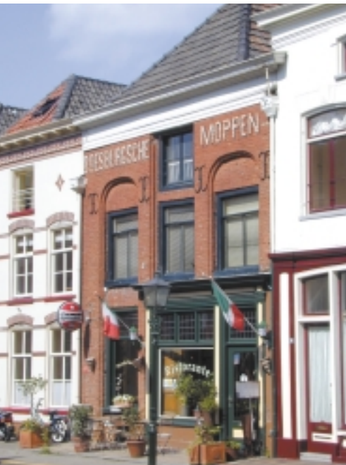
16de-eeuws woonhuis in Doesburg. Alle generaties pasten aan en verbouwden, waarvan dit monumentale huis met bedrijfsdeelte op een charmante wijze getuigt. Voorbeeld van blijvende functionaliteit en ononderbroken hergebruik

Tegelijkertijd schuilen in dit soort bouwfysische 'verbeteringen' enorme risico's, omdat het klimatologisch wijzigen van het gebouwconcept bijna steeds tot onverwachte en op termijn zeer schadelijke gevolgen leidt. Zo kan het volledig afdichten van kieren in kappen, rond kozijnen en beschietingen de noodzakelijke ventilatie van het historische houtwerk belemmeren, waardoor er binnen enkele jaren houtrot optreedt in de soms eeuwenoude, waardevolle constructie. Energetische winst wordt zo in meer dan een opzicht tot verlies: het materiaal moet op den duur worden vervangen en - ernstiger - historische bouwkundige waarden gaan verloren. Voor monumenten zit de duurzaamheid dus in de toegepaste – en toe te passen – materialen: als het energieverbruik binnen redelijke perken kan worden gehouden, zal ons gebouwde erfgoed door een uitstekende score op het gebied van materialen prima kunnen voldoen aan de huidige wens tot duurzaam bouwen. Die goede materiaalscore compenseert de zwakkere elementen van duurzaamheid van een monument en sluit naadloos aan bij het credo van de monumentenzorg 'behoud gaat voor vernieuwen'. Hergebruik is daarmee voor monumenten van extra betekenis.