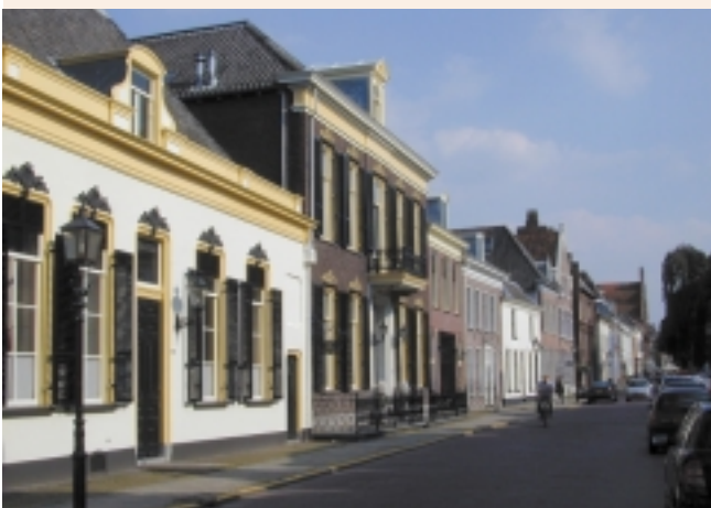
Monumenten 'van alle leeftijden' in Doesburg (16de tot vroege 20ste eeuw), als woonbuis, bedrijfspand en kantoor nog steeds volop in gebruik en maatschappelijk levend; duurzaam en dierbaar